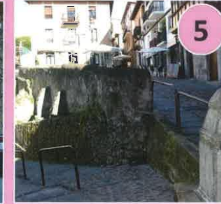
Puerta de la Escala, s. XIV Otros nombres: de la Escala del Muelle. Dirección: Escalera que bajaba al muelle desde el Merenillo.