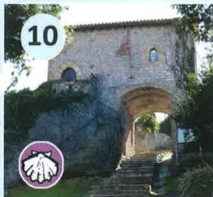
Puerta del Horado, s. XIV Dirección: Fuente y lavadero del despeñadero desde Calle San Francisco.