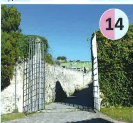
Puerta de la Blanca, s. XIII Otros nombres: de San Martín. Dirección: Monasterio de San Martín desde la Rúa San Martín.