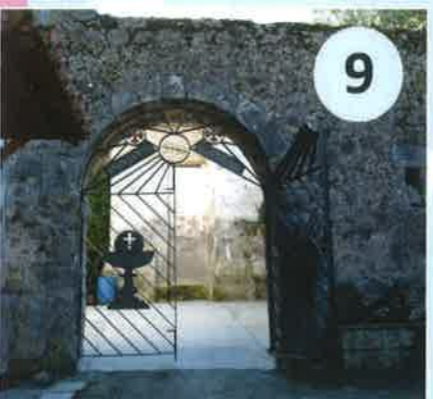
Puerta de la Mar, s. XV Otros nombres: de Cabe Arnao, del Arrabal y de Santa María de los Portales. Dirección: Castilla desde Calle Cordoneros, actual San Francisco. Integrada en el palacio Zarauz desde el s. XVIII.