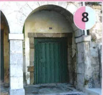
Puerta del Ras, s. XIV Otros nombres: de la Villa, del Arenal, del Azogue, del Puerto Chico y de la Torre. Dirección: Castilla desde la plaza de las Pilas del Pescado, actual Plaza Cachupín.