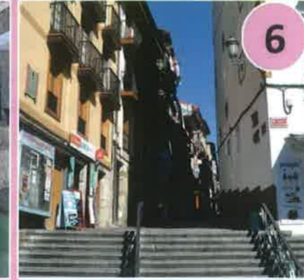
Puerta de Lampiazo, s. XVI Dirección: Muelles y astilleros de Lampiazo desde la Rúa Mayor. Actual Cuesta del Infierno.